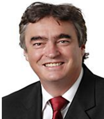
dr. Milan Zver ELS/SDS