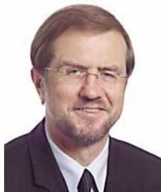
Lojze Peterle ELS / NSi