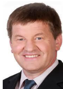
Franc Bogovič ELS/SLS