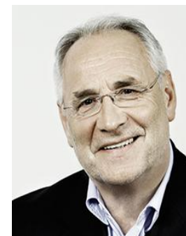
Ivo Vajgl ALDE/DeSUS